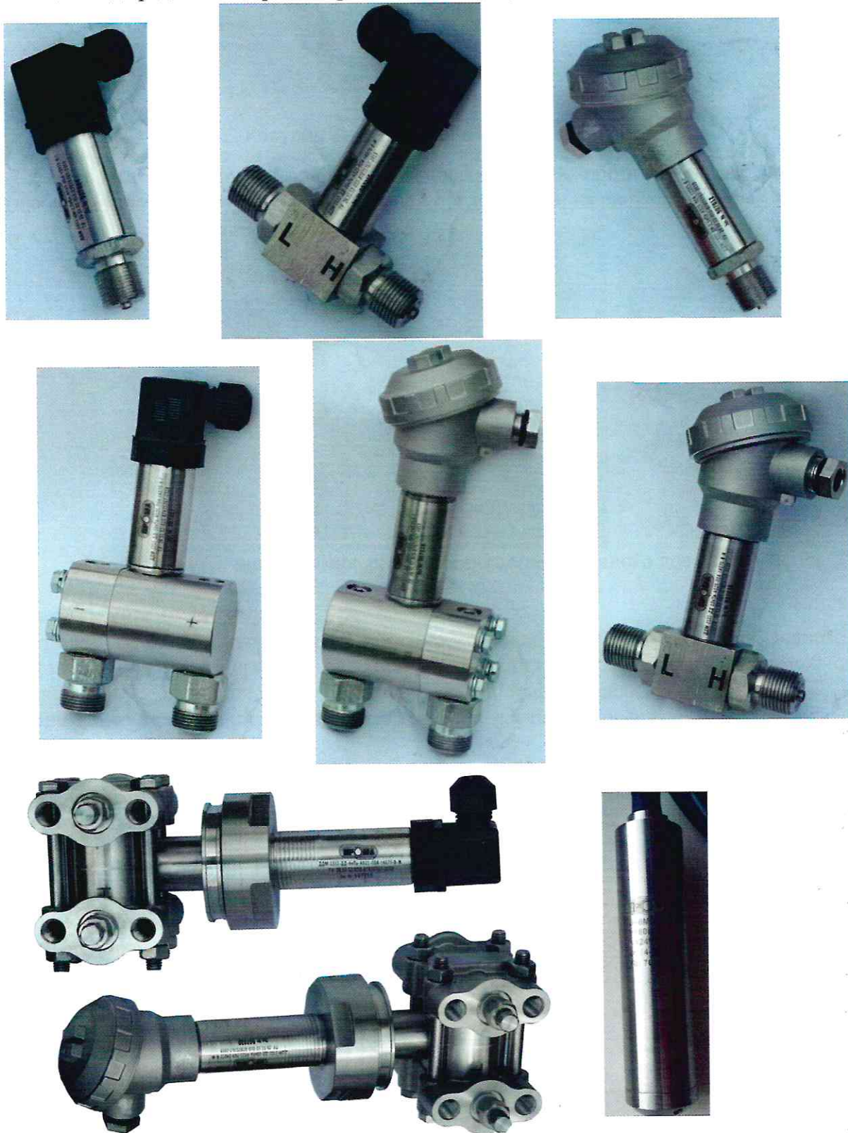
Рисунок 1 – Общий вид датчиков

12 – Выходной сигнал: «-» - от 4 до 20 мА; 485 – RS-485; Н – от 4 до 20 мА с наложенным HART; Общий вид средства измерений представлен на рисунке 1.