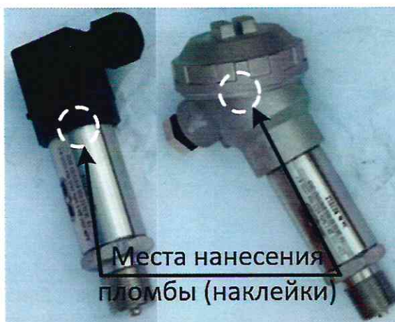
Рисунок 3 – Схема пломбировки от несанкционированного доступа

Схема пломбировки от несанкционированного доступа, обозначение мест нанесения пломб (наклейки) эксплуатирующей организацией представлены на рисунке 3.