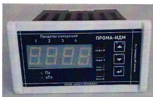
Рисунок 1 - Общий вид измерителей давления многофункциональных ПРОМА-ИДМ-016